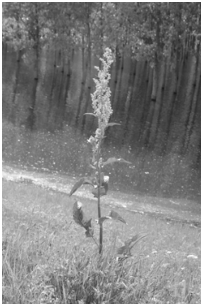
Felmagzott réti sóska a torkolati gátoldalban

Közeli rokon nemzetséget alkotnak a rebarbarák, amelyek közül többnek a vastag és húsos-leves levélnyelét fogyasztják. Ugyanis a legtöbbjének magas az almasav tartalma, amit főzeléknek, sőt sütemény tölteléknek egyaránt alkalmas. Nálunk nem