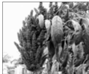
A rokonság – mint szőrös disznóparéj